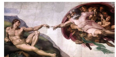
Bild: the creation of adam

Ich mag die Vorstellung, Teil einer großen Gemeinschaft zu sein, welche durch den göttlichen Lebensfunken in Liebe erschaffen wurde. Sollte ich mit meinen Beobachtungen recht haben, ging durch die Impfung viel mehr als nur die jeweilige körperliche Gesundheit verloren - den Geimpften ging ihre Seelengemeinschaft verloren .. vlt. kommt ihr kaltes menschenverachtendes Verhalten genau daher .. (allein, ohne Anbindung an ihre Seelengemeinschaft) ?